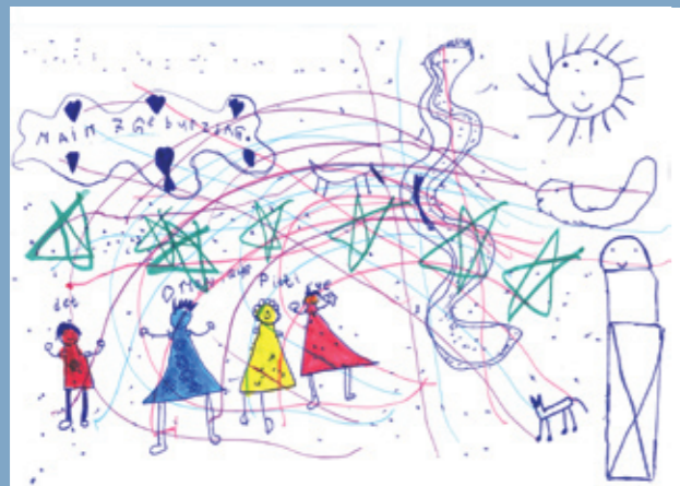
unten rechts: Monique: wo ich Aufgenomen bin