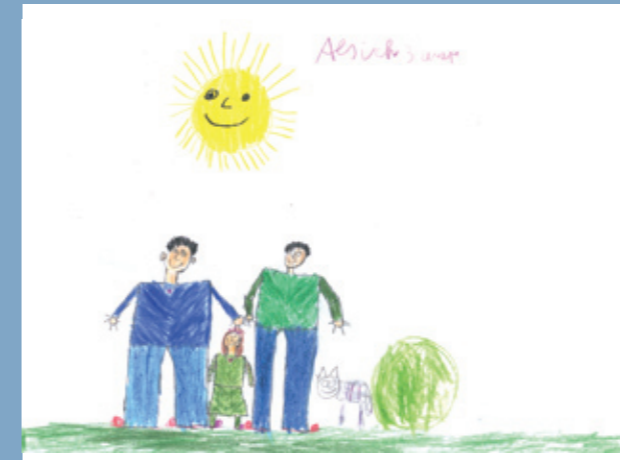
oben links: Sue: als ich drei Jahre alt wa