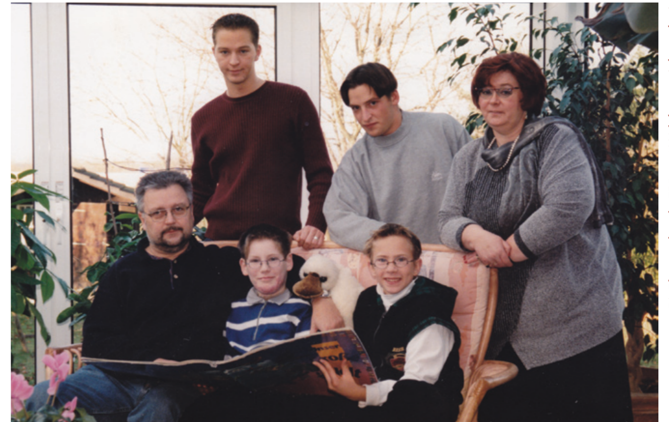
Die Planungsphase des EBR vor 1999 bekamen wir hautnah mit.

Die folgende Zeit wurde durch die Pubertät sehr schwierig. Oh, er war nie frech, nicht aggressiv, und benutzte keine Schimpfworte. Er ging in die Verweigerung, kehrte aus der Disco erst Stunden nach dem abgesprochenen Zeitpunkt zurück. Die letzten vier Wochen Schule schenkte er sich. Ich brachte ihn vorne rein, er verschwand durch den Hinterausgang. Eine Drückerkolonne hatte ihn aufgetan. Nur mit Hilfe der damaligen Freundin konnten wir ihn davon abhalten. Mit 18 zog er dann zu ihr, tat gar nichts und machte leider Bekanntschaft mit Drogen. Aus diesem Grund endete seine hoffnungsvolle Karriere im Judo. Nach neun Monaten hörten wir: „Ich habe mir einen Job gesucht. Mir wurde dort eine Lehrstelle