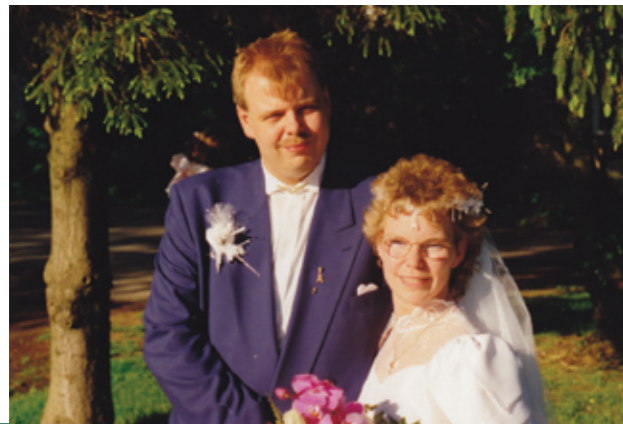
Unten links: Mut steht am Anfang des Handelns... Unten rechts: Am Ende das Glück?

Mit vielen Höhen und Tiefen sind wir nun wie mein in sich geschlossener Kreis. Wir sind miteinander glücklich und entwickeln uns stets weiter fort.