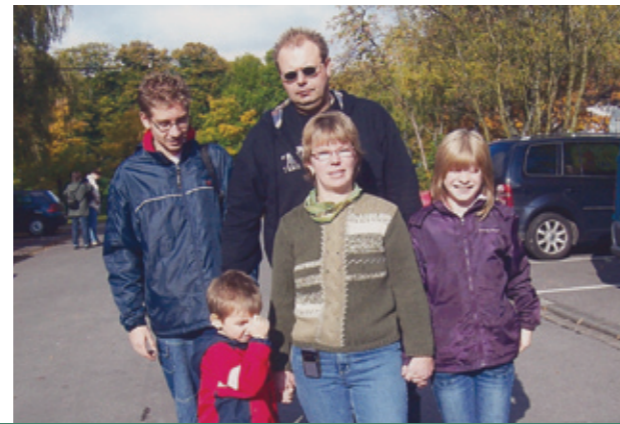
Unten links: Das erste Kind „Klein Bübchen.“